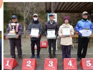
グラウンド・ゴルフ入場者数↓

* 次回の開催は3月17日(火)弘栄工務店カップ(スポンサー (有)弘栄工務店殿) 年間のグランドチャンピオンの表彰も行います